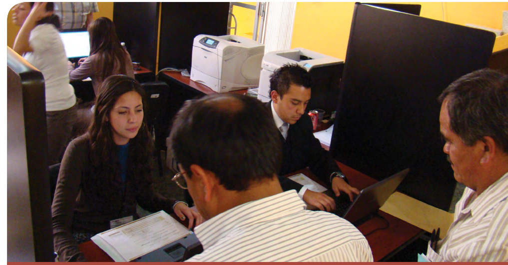
Recepción de Declaraciones de Situación Patrimonial

Los recursos federales que recibe el OFS Puebla de la Auditoría Superior de la Federación a través del Programa para la Fiscalización del Gasto Federalizado (PROFIS), fortalecieron las funciones sustantivas de la fiscalización. Un compromiso permanente en el ejercicio de dichos recursos ha sido el principio de eficiencia en la adquisición de equipo y en la mejora de infraestructura lo que permite dotar de los medios idóneos para desarrollar una efectiva gestión institucional.