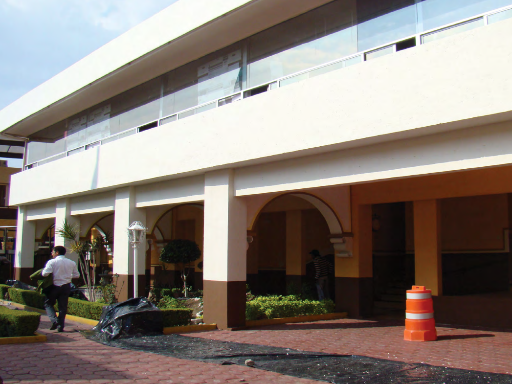
Programa emergente de mantenimiento