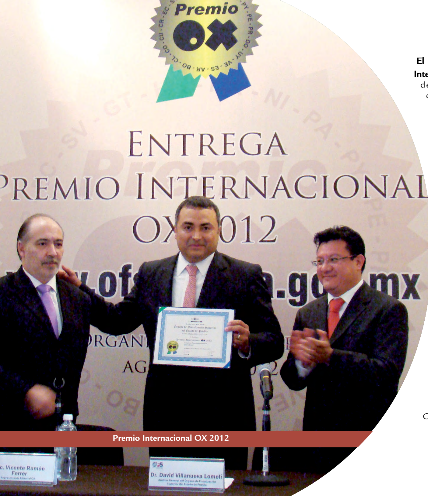
Premio Internacional OX 2012

En el periodo que se reporta, se cargaron más de 17,000 discos que contienen los Estados Financieros y alrededor de 5,000 discos con el registro contable de los bienes patrimoniales de los distintos Sujetos de Revisión Obligados, integrándolos en la base de datos de la Institución para efectuar la Fiscalización Superior de las Cuentas Públicas.