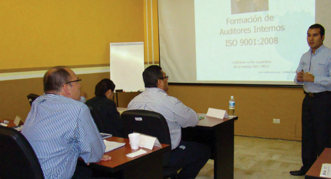
Curso “Formación de Auditores Internos ISO 9001:2008”