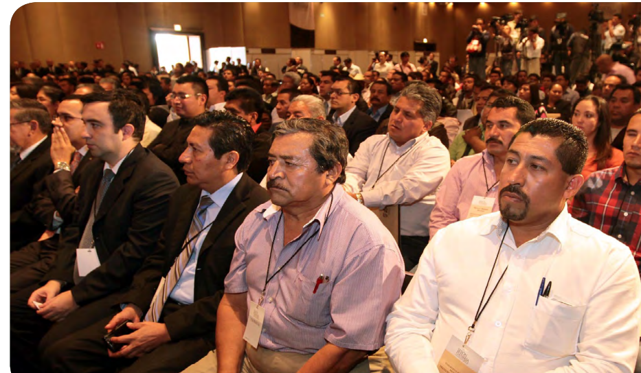
Asistentes a la Sesión Plenaria de Inicio de Capacitación 2012.

En el periodo se realizaron 70 cursos en diferentes temas, entre los que destacan Sistema Contable Gubernamental, Fiscalización Municipal, Legalidad, Informática, Auditoría del Desempeño, Municipio Armonizado y Transparente, Irregularidades Recurrentes en el ejercicio de los Recursos Públicos, Presupuesto basado en Resultados y Cuenta Pública, logrando capacitar a 2,156 participantes.