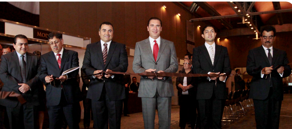
Inauguración de la Sesión Plenaria de Inicio de Capacitación 2012 para Ayuntamientos