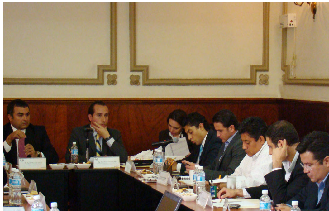
Sesión de la Comisión Inspectora