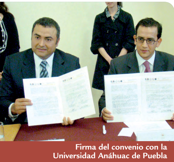
Firma del convenio con la Universidad Anáhuac de Puebla

colaboró en el Programa Beca un Niño Indígena, impulsado por el Sistema Estatal para el Desarrollo Integral de la Familia del Gobierno del estado de Puebla, con el fin de apadrinar a niños y niñas del albergue Juan Álvarez del municipio de Chilchotla ubicado en la región Serdán. Cabe destacar la participación de las esposas voluntarias de los servidores públicos en estas acciones.