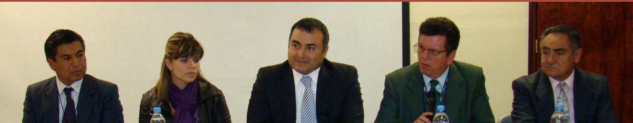
Curso “Construcción de Indicadores Efectivos para la Gestión Gubernamental”

A partir del mes de mayo de 2012, la totalidad de los servidores públicos adscritos a la Auditoría Especial de Evaluación del Desempeño, así como de otras unidades administrativas del OFS Puebla iniciaron el diplomado de alta especialidad denominado “Presupuesto Basado en Resultados (PBR)”, impartido por la Secretaría de Hacienda y Crédito Público en coordinación con la Universidad Nacional Autónoma de México; mismo que tiene como propósito apoyar la implantación de un Modelo de Gestión para Resultados.