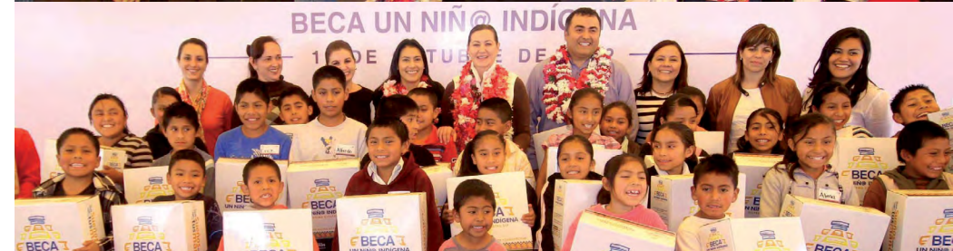
Entrega de donativo al Programa “Beca un niño indígena”

implementa el Instituto de Capacitación y Desarrollo en Fiscalización Superior (ICADEFIS). Este tipo de participaciones permiten contar con profesionales especializados en materia de fiscalización, así como reforzar el actuar imparcial y objetivo de los servidores públicos de esta Entidad Fiscalizadora.