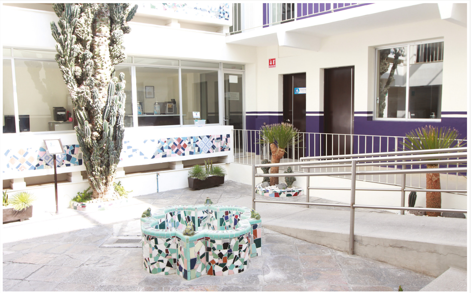
↑ "Patio de las Ranas" Auditoría Superior del Estado de Puebla