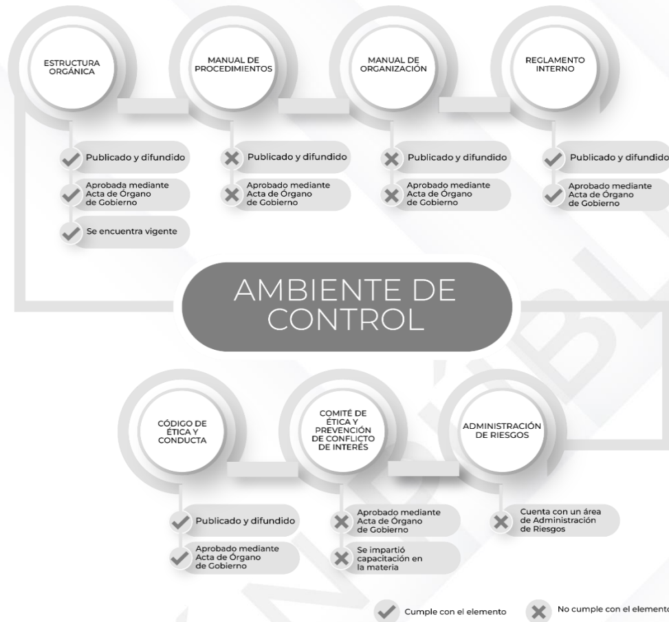
Ilustración 3. Resultados de los procedimientos de los Mecanismos de Control Interno