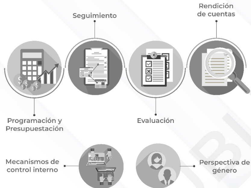
Ilustración 2. Procedimientos generales de la auditoría de desempeño 2022