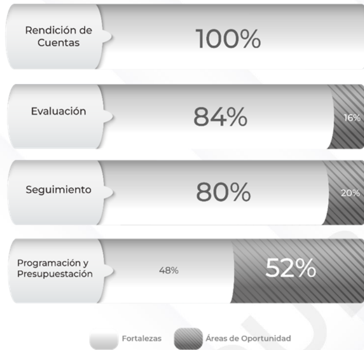
Gráfico 1. Resultados de los procedimientos generales relacionados al ciclo presupuestario