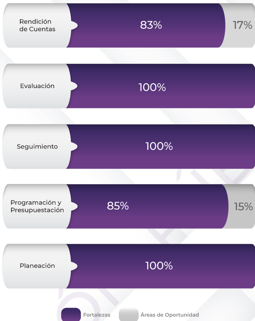
Gráfico 1. Resultados de los procedimientos generales relacionados al ciclo presupuestario