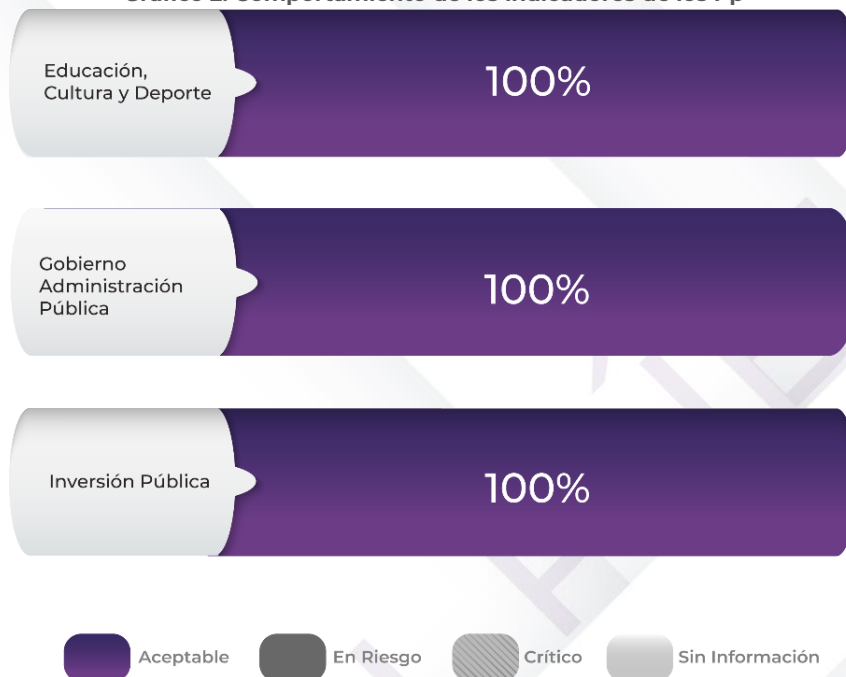
Gráfico 2. Comportamiento de los indicadores de los Pp