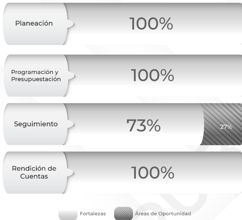
Gráfico 1. Resultados de los procedimientos relacionados al Ciclo Presupuestario