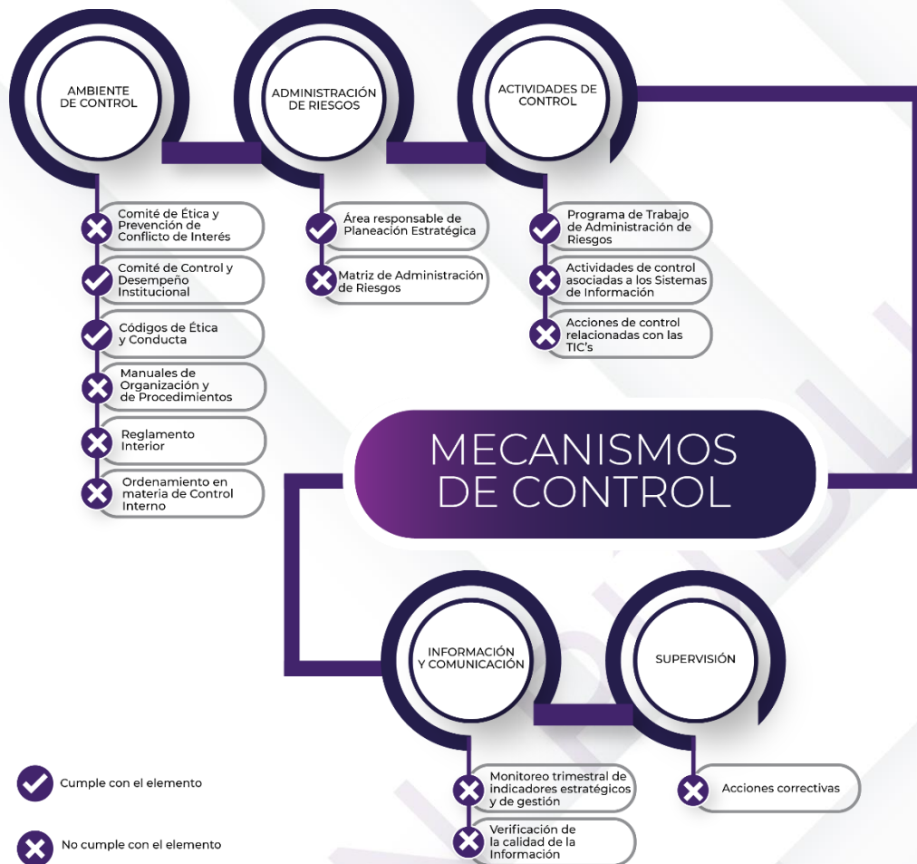
Ilustración 3. Resultados de los procedimientos específicos de los Mecanismos de Control Interno