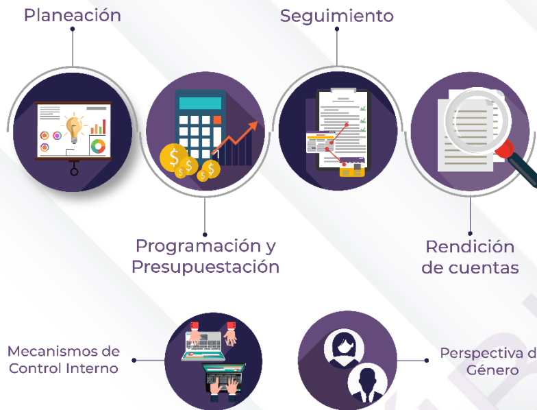
Ilustración 2. Procedimientos generales de la auditoría de desempeño 2022