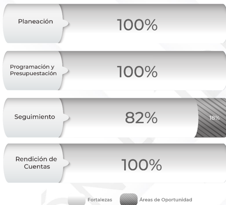
Gráfico 1. Resultados de los procedimientos relacionados al Ciclo Presupuestario