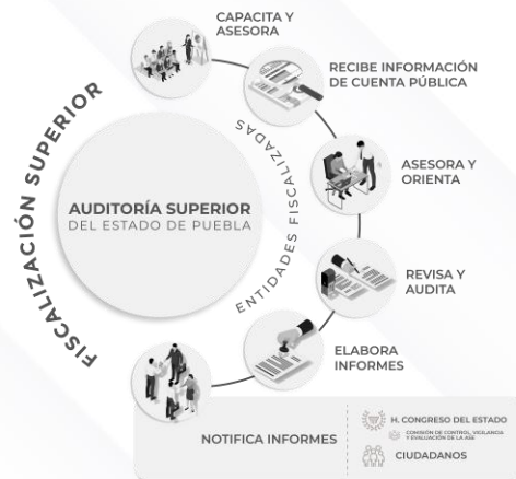
Ilustración 1. Proceso de Fiscalización Superior