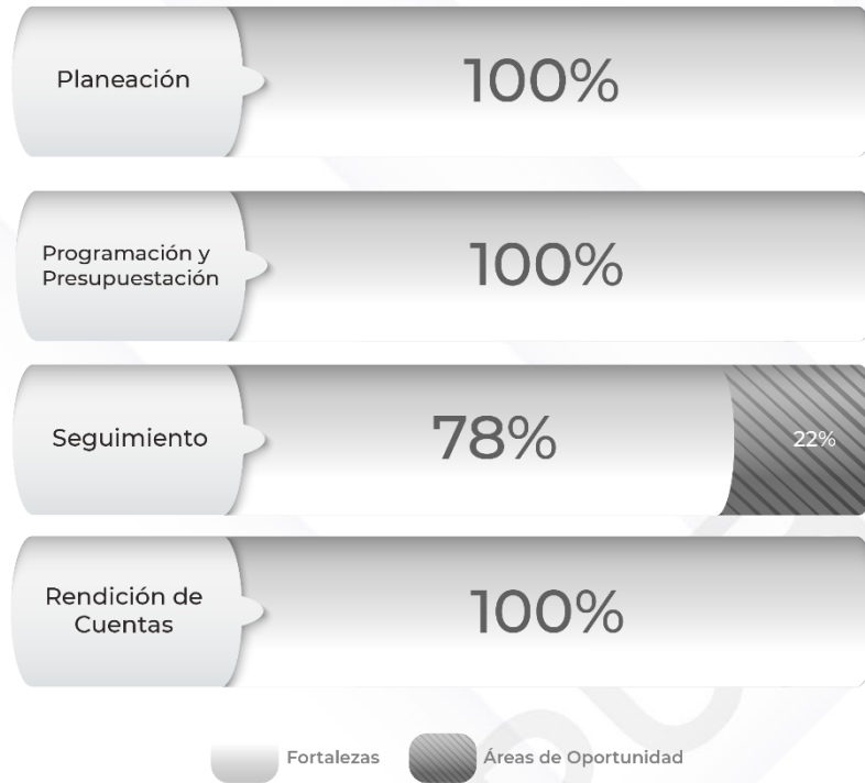
Gráfico 1. Resultados de los procedimientos relacionados al Ciclo Presupuestario