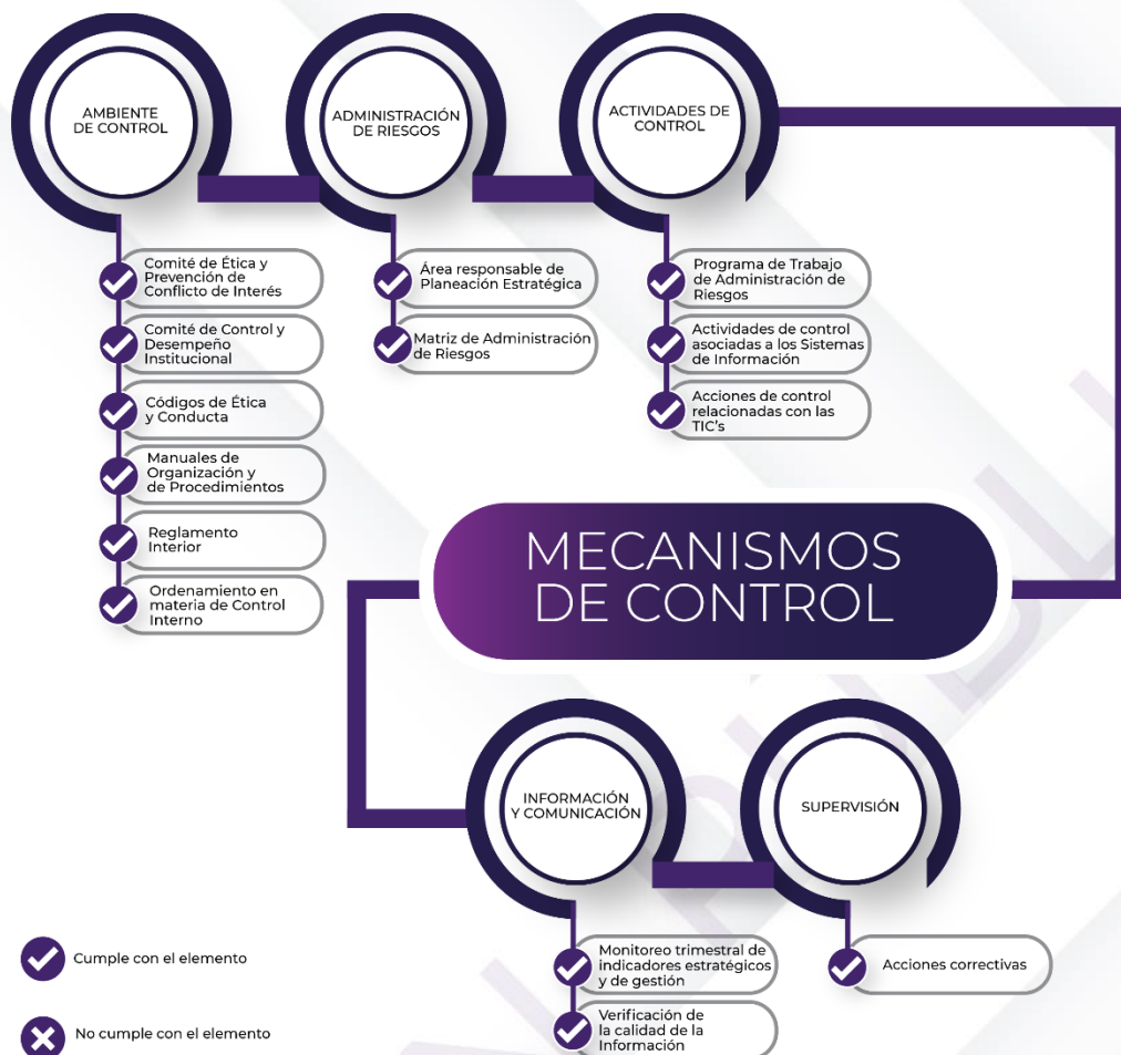
Ilustración 3. Resultados de los procedimientos específicos de los Mecanismos de Control Interno