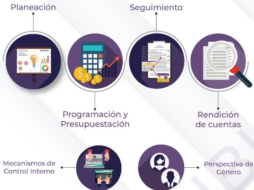
Ilustración 2. Procedimientos generales de la auditoría de desempeño 2022