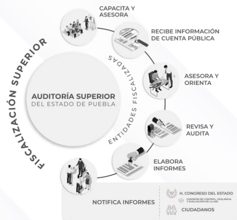
Ilustración 1. Proceso de Fiscalización Superior