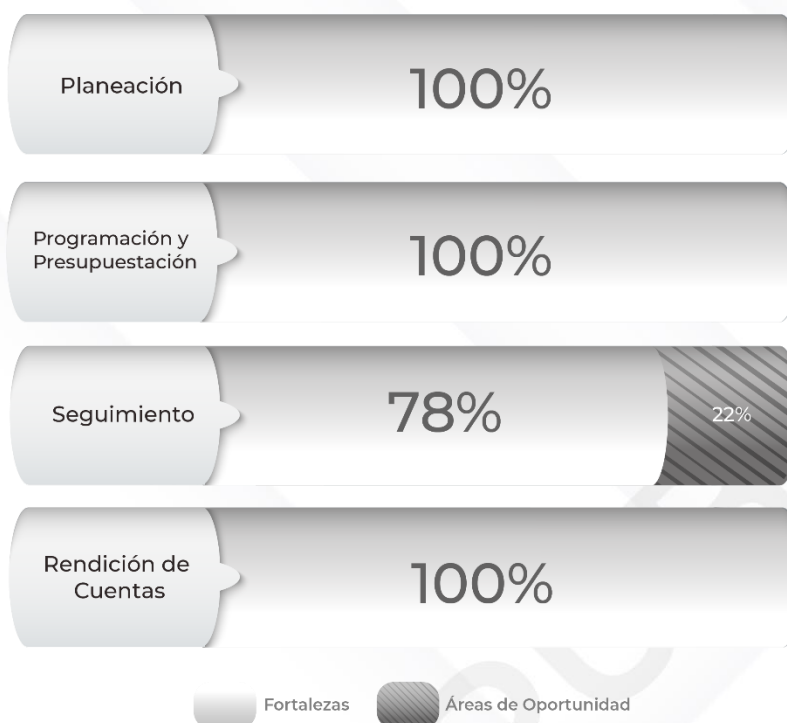
Gráfico 1. Resultados de los procedimientos relacionados al Ciclo Presupuestario