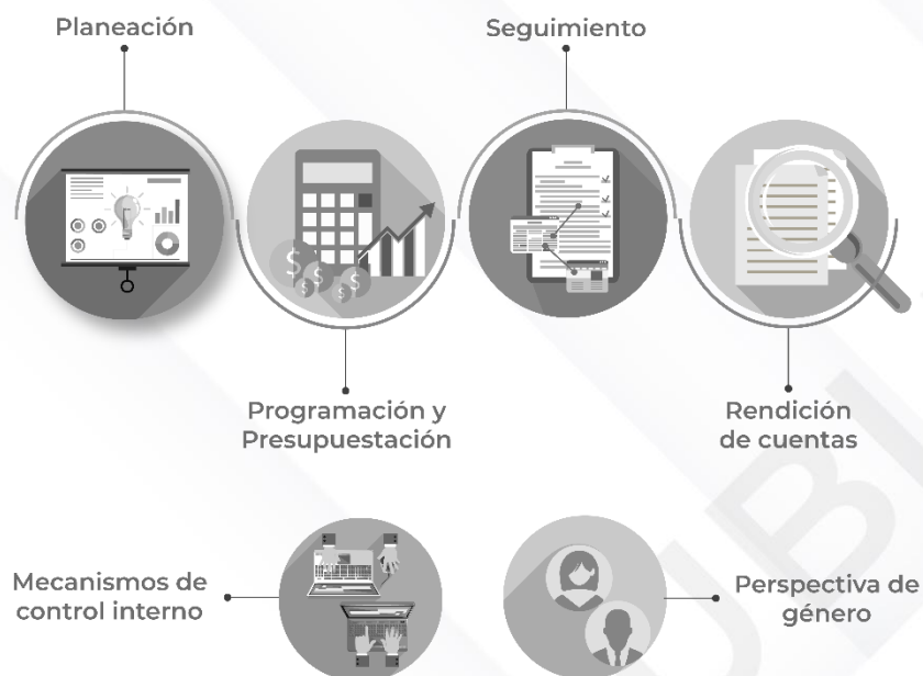
Ilustración 2. Procedimientos generales de la auditoría de desempeño 2022