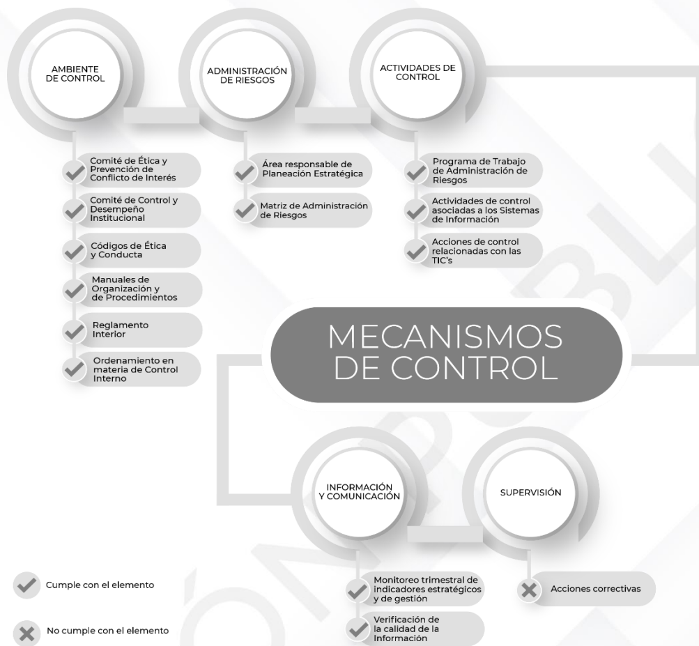
Ilustración 3. Resultados de los procedimientos específicos de los Mecanismos de Control Interno