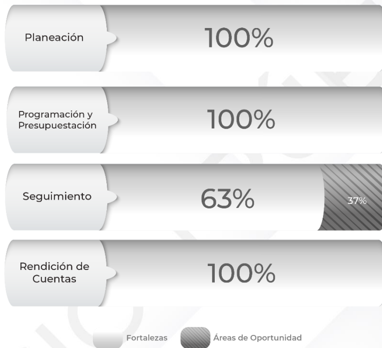
Gráfico 1. Resultados de los procedimientos relacionados al Ciclo Presupuestario