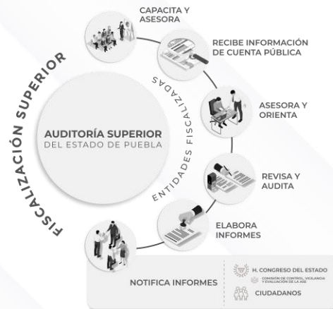
Ilustración 1. Proceso de Fiscalización Superior