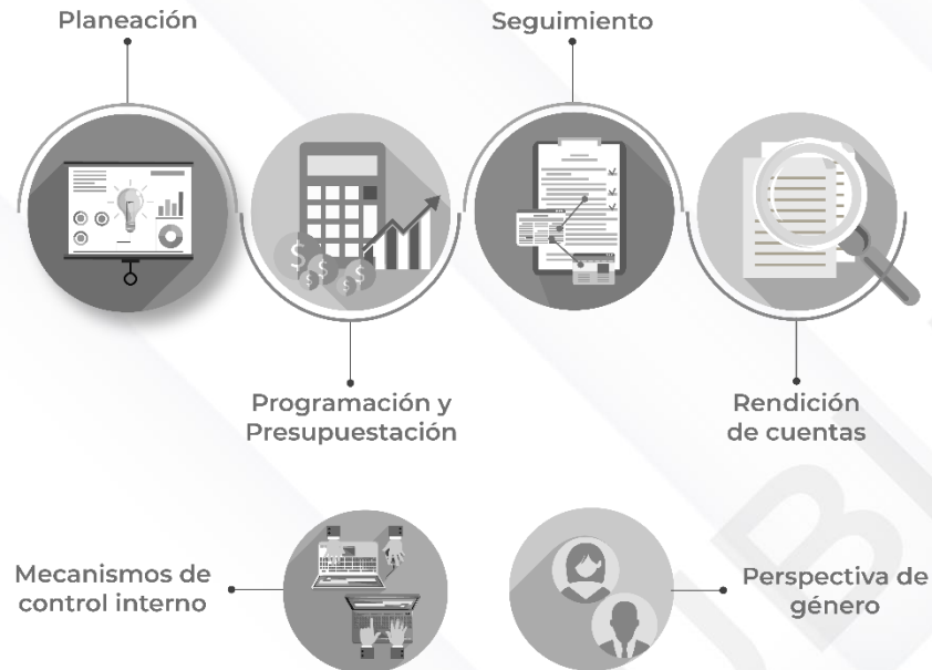
Ilustración 2. Procedimientos generales de la auditoría de desempeño 2022