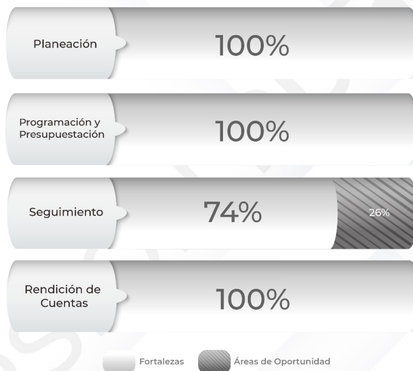
Gráfico 1. Resultados de los procedimientos relacionados al Ciclo Presupuestario