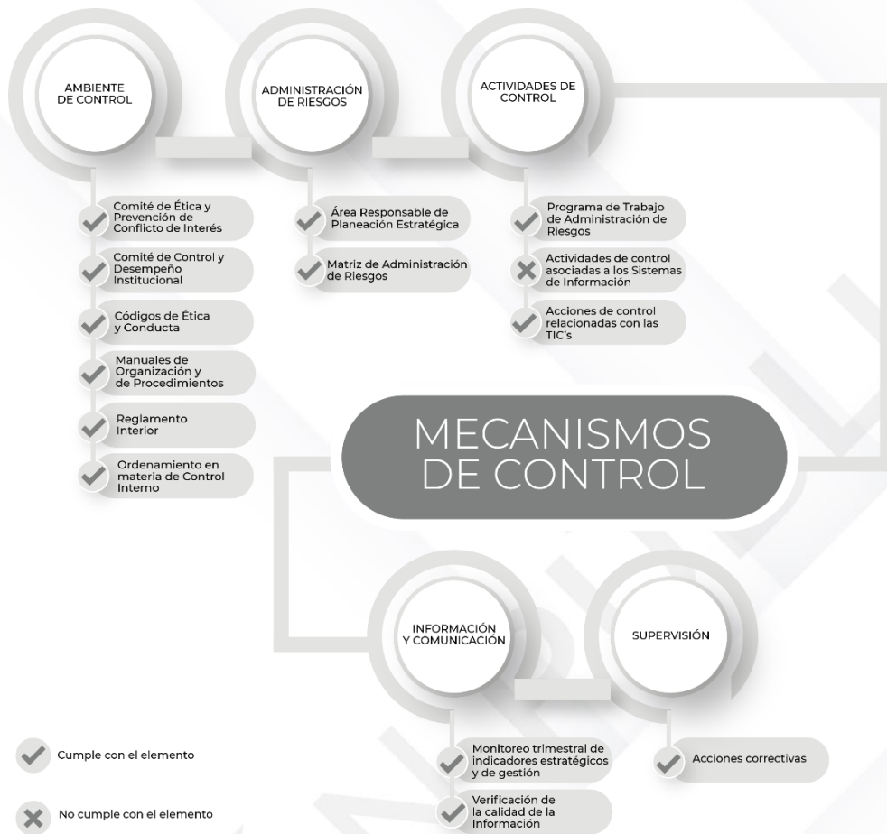
Ilustración 3. Resultados de los procedimientos específicos de los Mecanismos de Control Interno