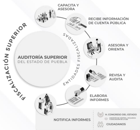
Ilustración 1. Proceso de Fiscalización Superior