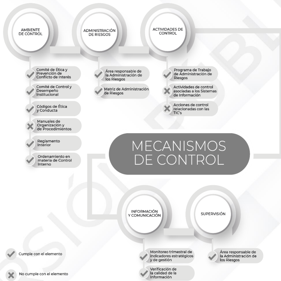
Ilustración 3. Resultados de los procedimientos específicos de los Mecanismos de Control Interno