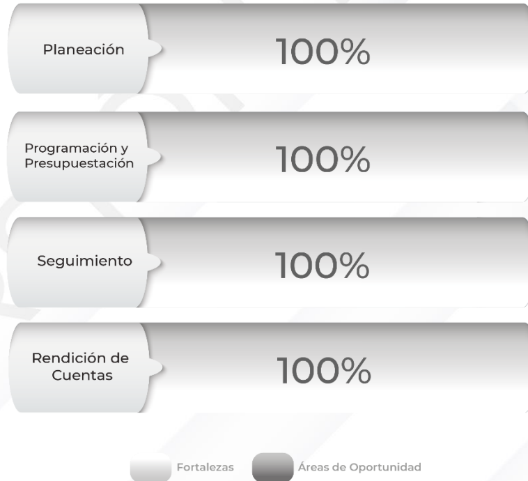
Gráfico 1. Resultados de los procedimientos relacionados al Ciclo Presupuestario