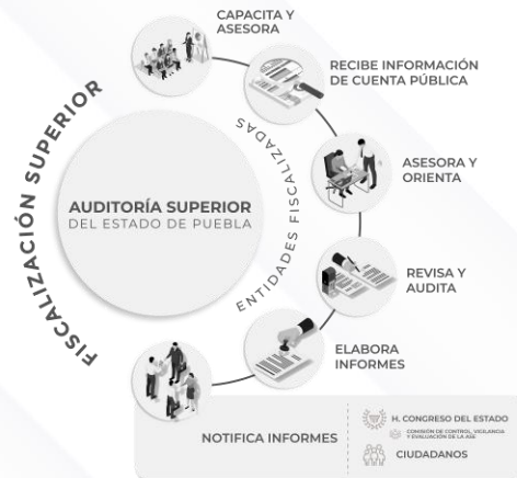
Ilustración 1. Proceso de Fiscalización Superior