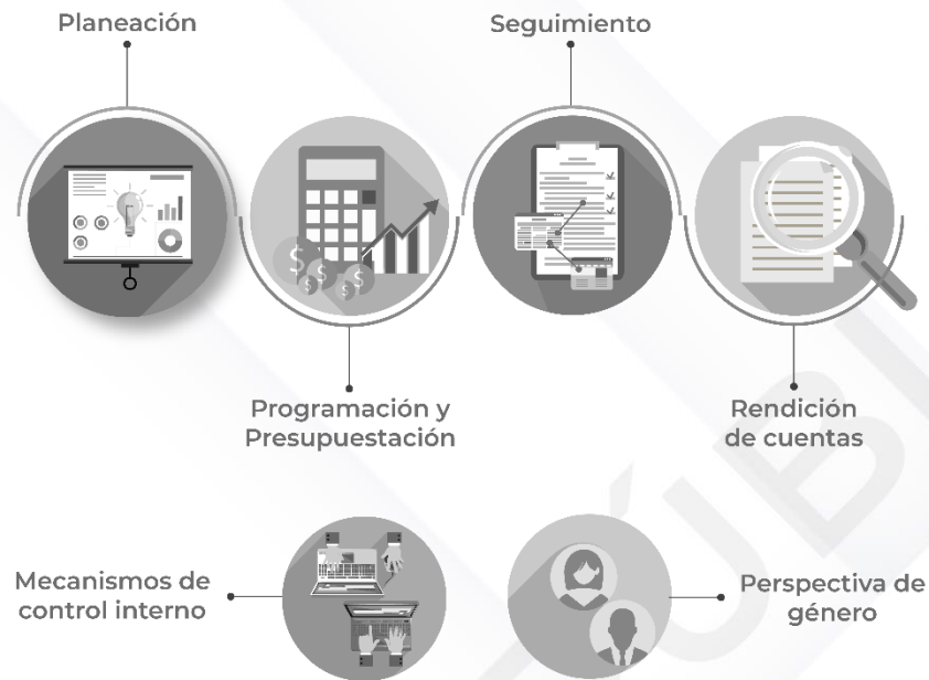
Ilustración 2. Procedimientos generales de la auditoría de desempeño 2022