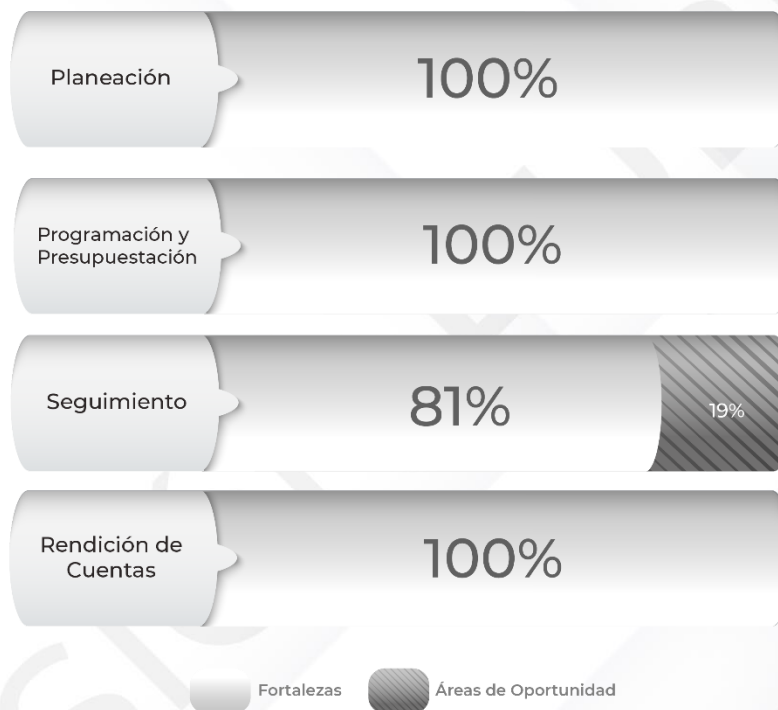
Gráfico 1. Resultados de los procedimientos relacionados al Ciclo Presupuestario