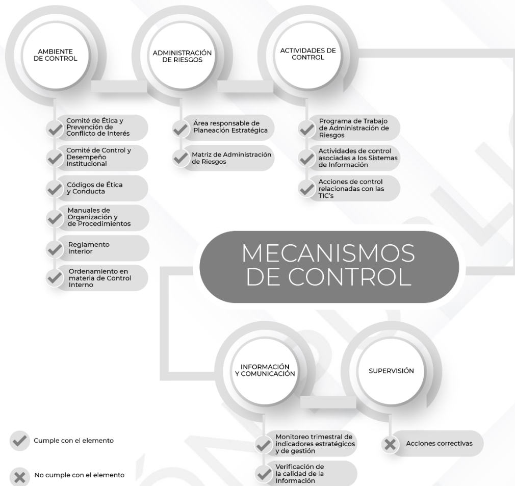
Ilustración 3. Resultados de los procedimientos específicos de los Mecanismos de Control Interno