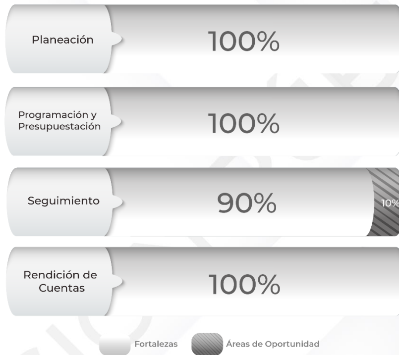
Gráfico 1. Resultados de los procedimientos relacionados al Ciclo Presupuestario