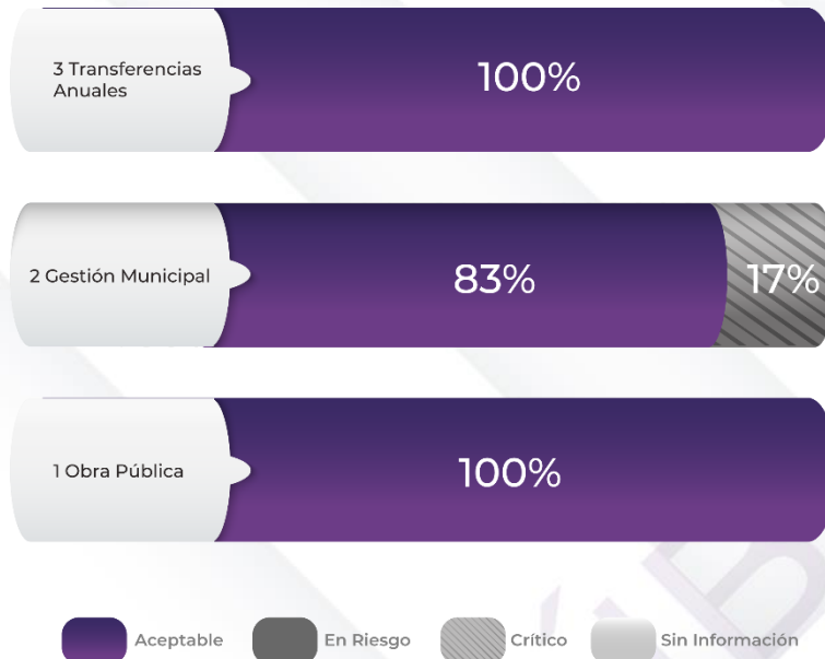
Gráfico 2. Comportamiento de los indicadores de los Pp