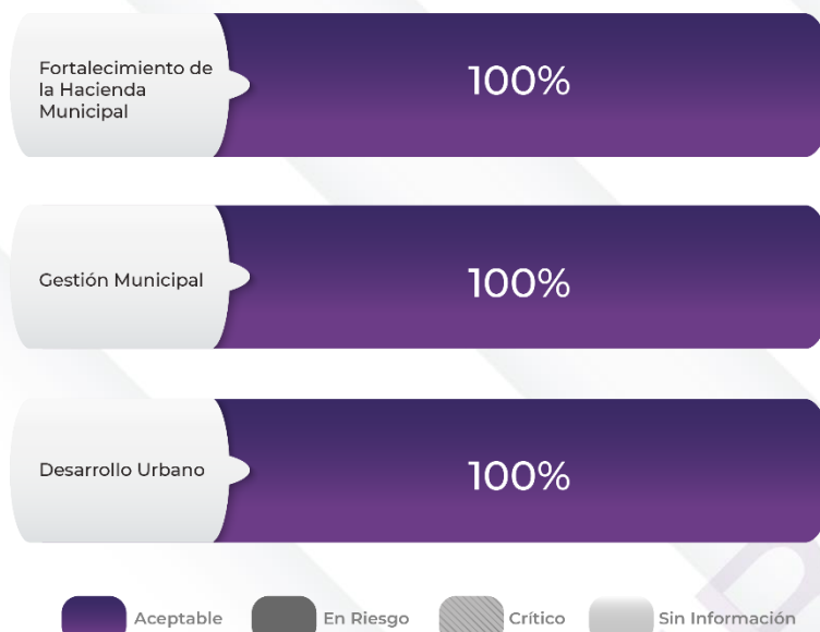
Gráfico 1. Comportamiento de los indicadores de los Pp