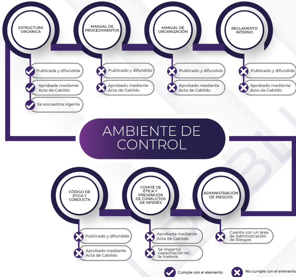
Ilustración 3. Resultados de los procedimientos de los Mecanismos de Control Interno