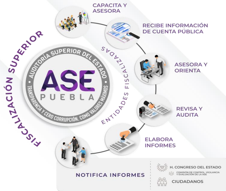
Ilustración 1. Proceso de Fiscalización Superior