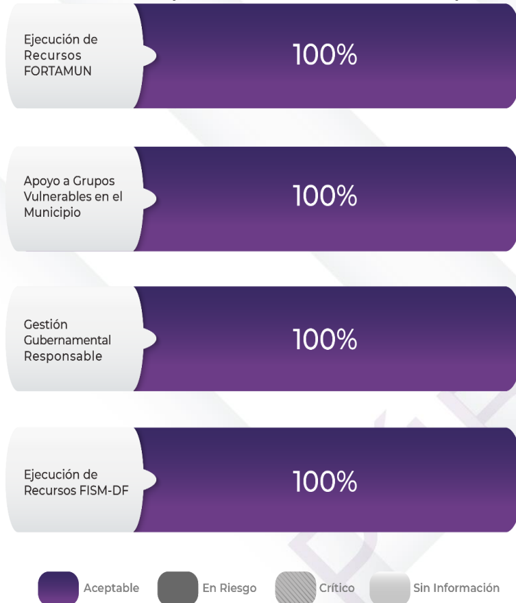
Gráfico 2. Comportamiento de los indicadores del Pp.