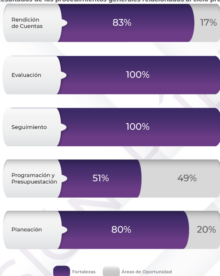
Gráfico 1. Resultados de los procedimientos generales relacionados al ciclo presupuestario

Fuente: Elaboración propia con base en los resultados del proceso analítico de revisión y valoración de la documentación remitida por la Entidad Fiscalizada en atención al requerimiento de información inicial, Cuenta Pública 2022.