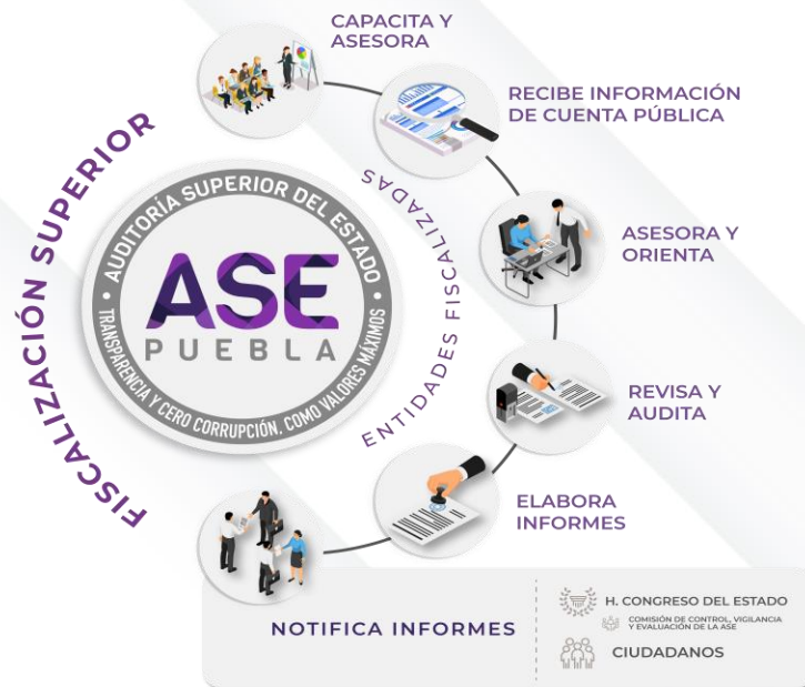
Ilustración 1. Proceso de Fiscalización Superior