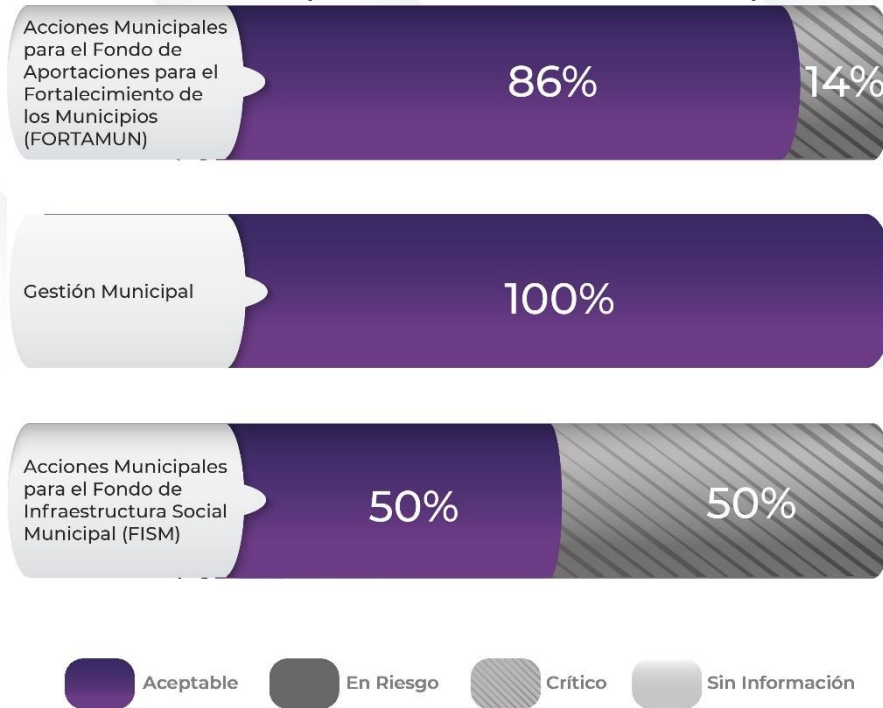
Gráfico 2. Comportamiento de los indicadores de los Pp