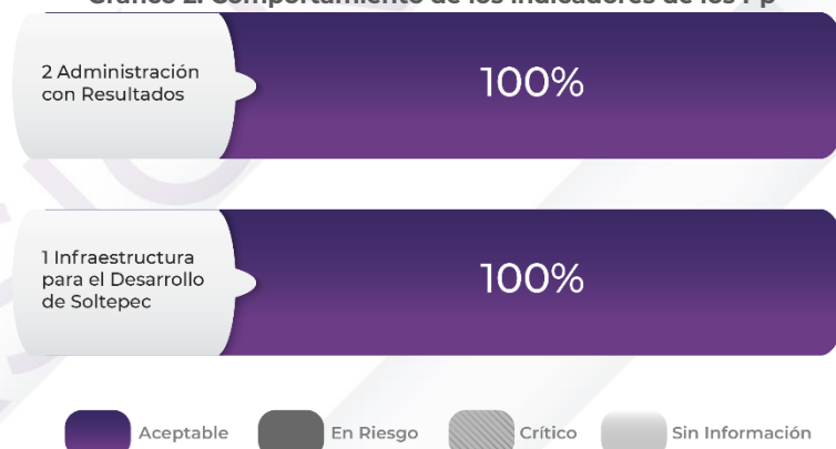
Gráfico 2. Comportamiento de los indicadores de los Pp