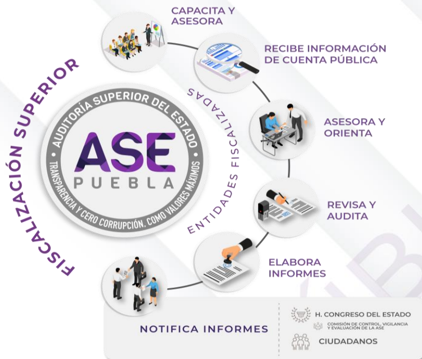
Ilustración 1. Proceso de Fiscalización Superior