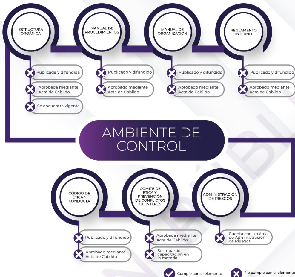
Ilustración 3. Resultados de los procedimientos de los Mecanismos de Control Interno