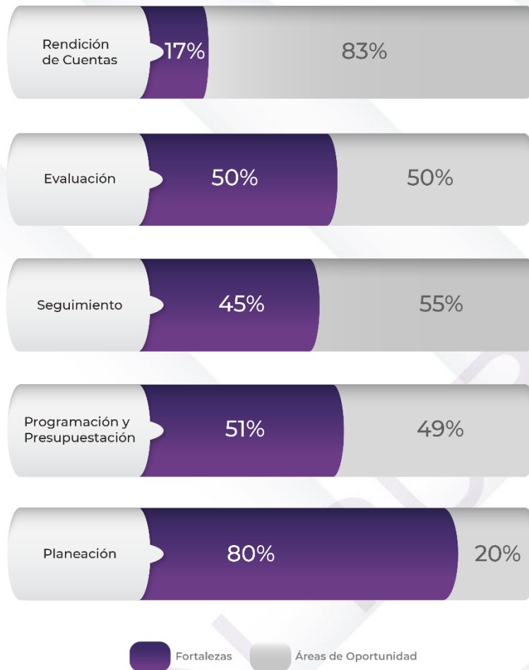
Gráfico 1. Resultados de los procedimientos generales relacionados al ciclo presupuestario

Fuente: Elaboración propia con base en los resultados del proceso analítico de revisión y valoración de la documentación remitida por la Entidad Fiscalizada en atención al requerimiento de información inicial, Cuenta Pública 2022.