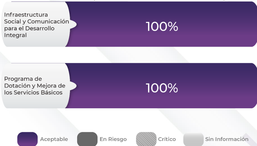
Gráfico 2. Comportamiento de los indicadores de los Pp