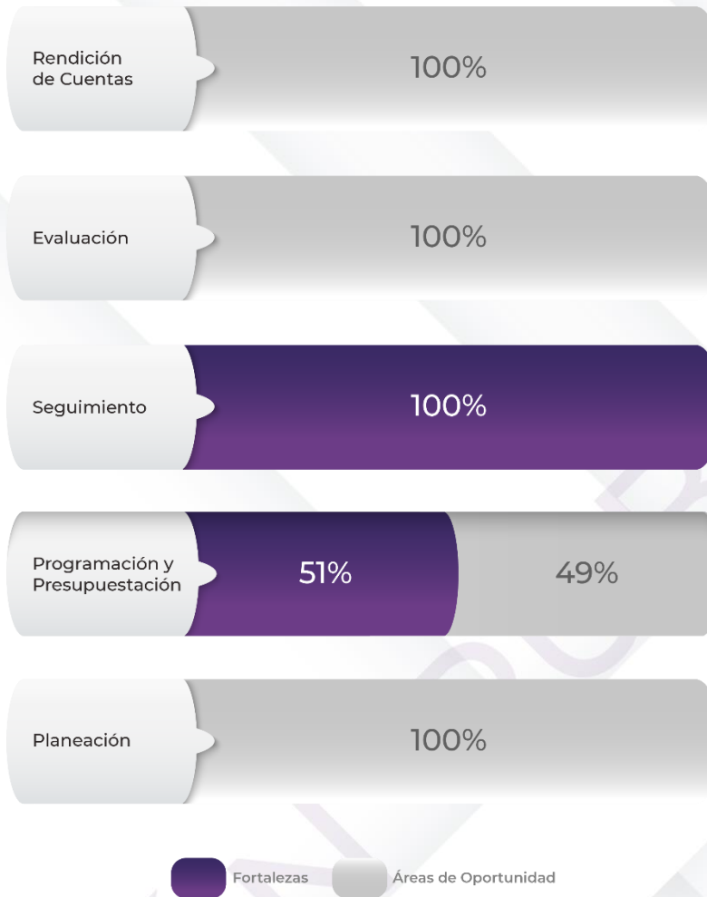
Gráfico 1. Resultados de los procedimientos generales relacionados al ciclo presupuestario