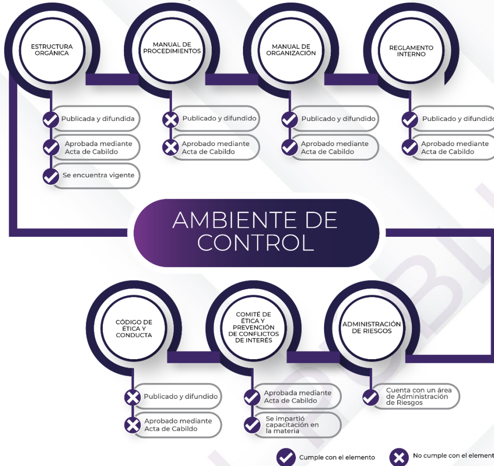
Ilustración 3. Resultados de los procedimientos de los Mecanismos de Control Interno