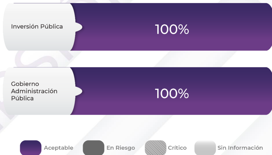
Gráfico 2. Comportamiento de los indicadores de los Pp