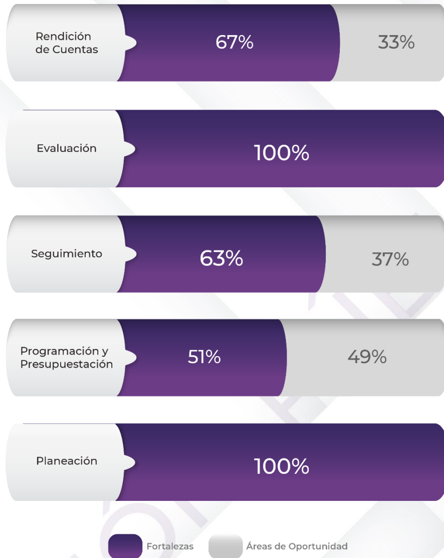
Gráfico 1. Resultados de los procedimientos generales relacionados al ciclo presupuestario