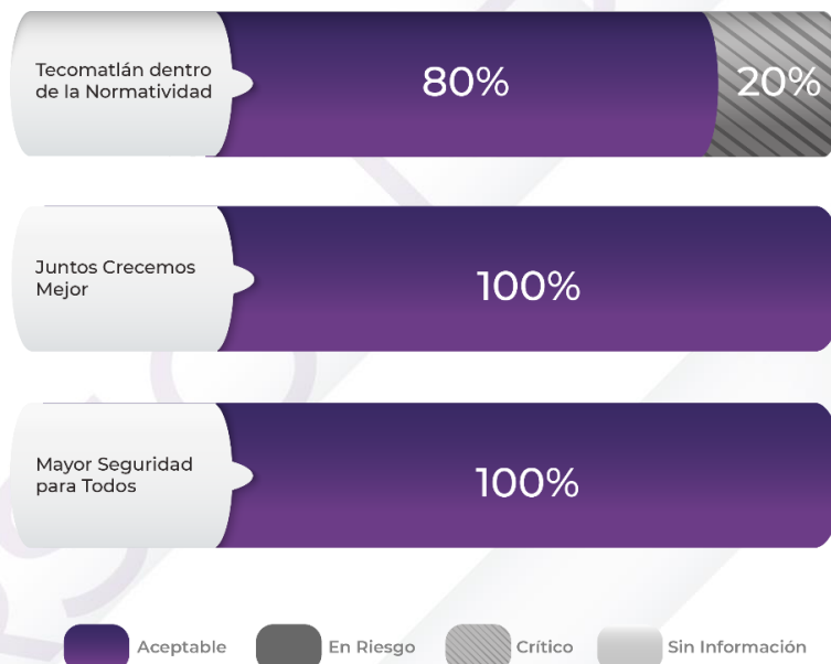
Gráfico 2. Comportamiento de los indicadores de los Pp