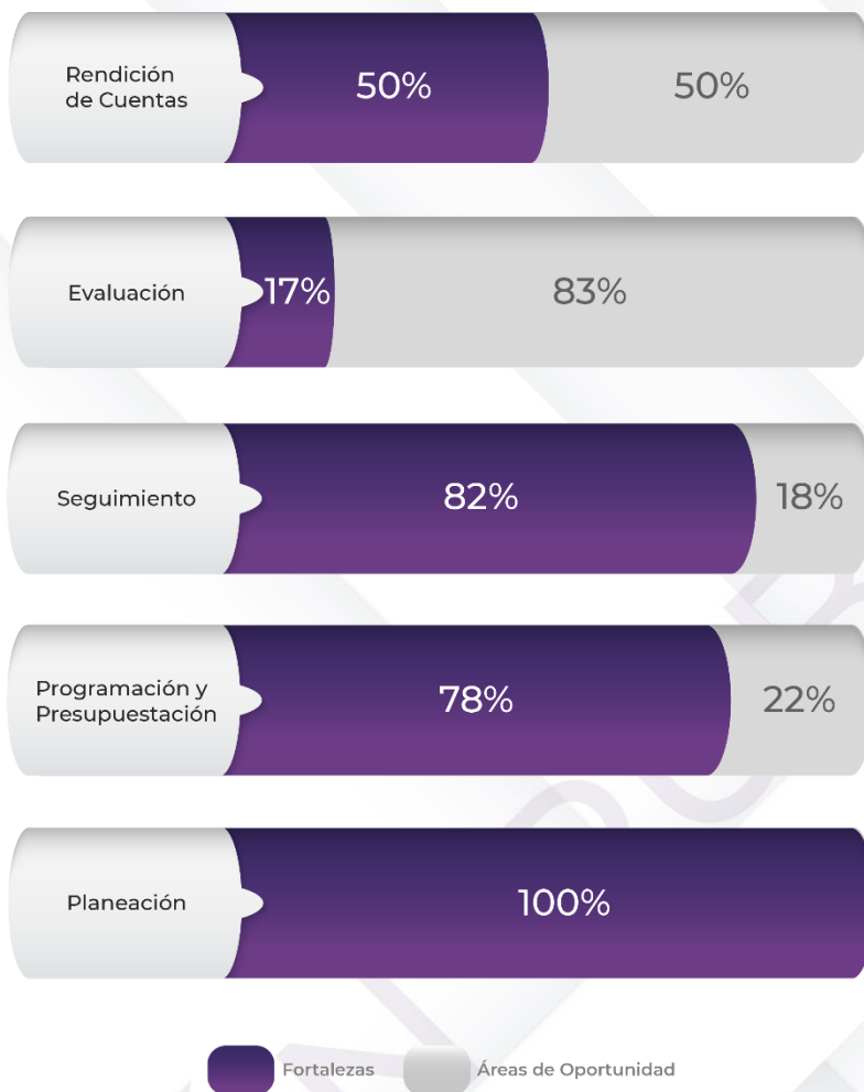
Gráfico 1. Resultados de los procedimientos generales relacionados al ciclo presupuestario