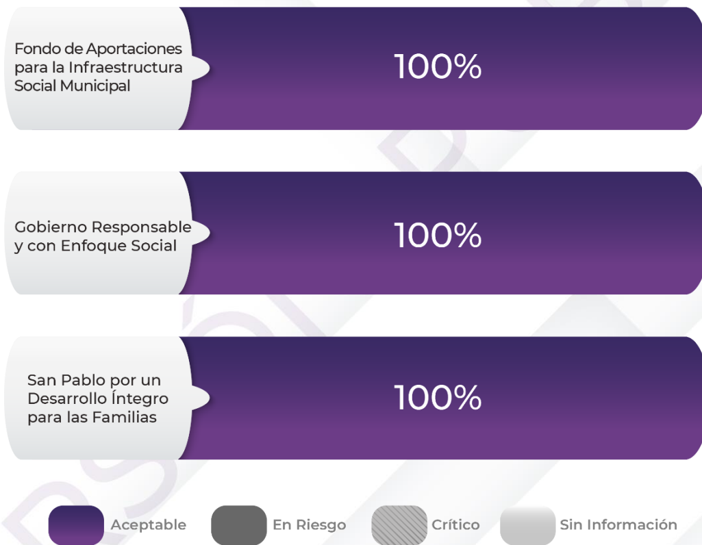
Gráfico 2. Comportamiento de los indicadores de los Pp

Fuente: Elaboración propia con base en los resultados obtenidos en el procedimiento específico “Cumplimiento Final de los Programas presupuestarios” de la auditoría de desempeño, Cuenta Pública 2022.