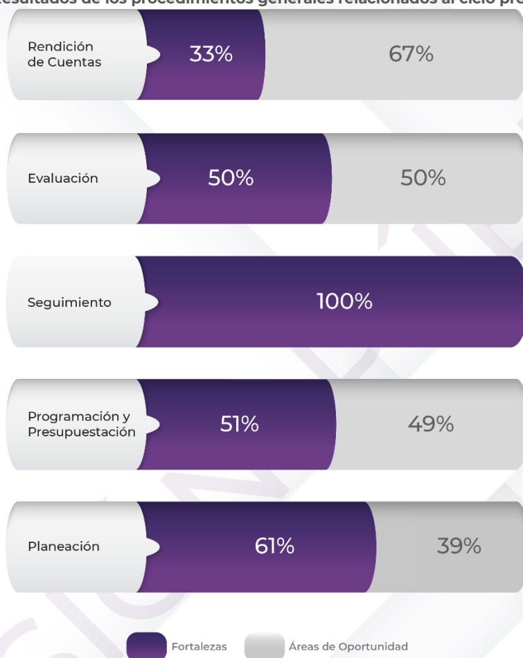
Gráfico 1. Resultados de los procedimientos generales relacionados al ciclo presupuestario