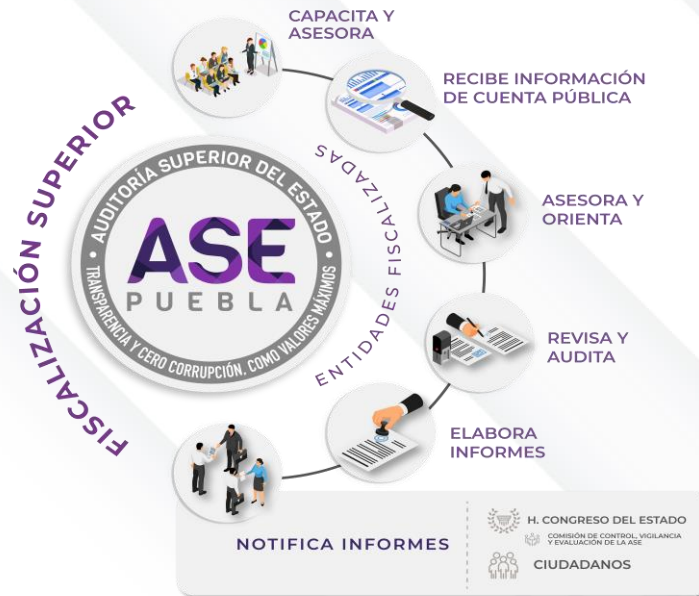
Ilustración 1. Proceso de Fiscalización Superior