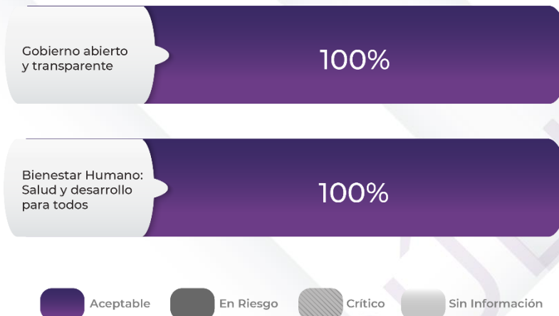
Gráfico 2. Comportamiento de los indicadores de los Pp

Fuente: Elaboración propia con base en los resultados obtenidos en el procedimiento específico “Cumplimiento Final de los Programas presupuestarios” de la auditoría de desempeño, Cuenta Pública 2022.