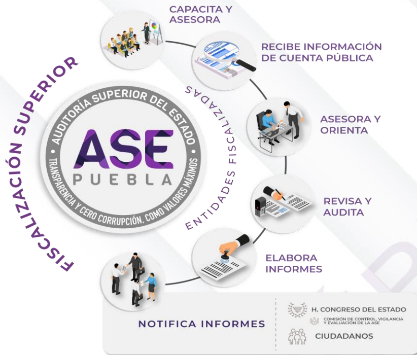
Ilustración 1. Proceso de Fiscalización Superior