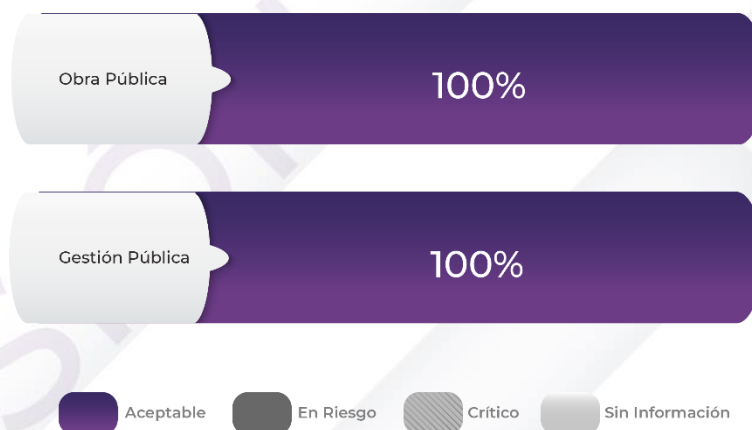
Gráfico 2. Comportamiento de los indicadores de los Pp