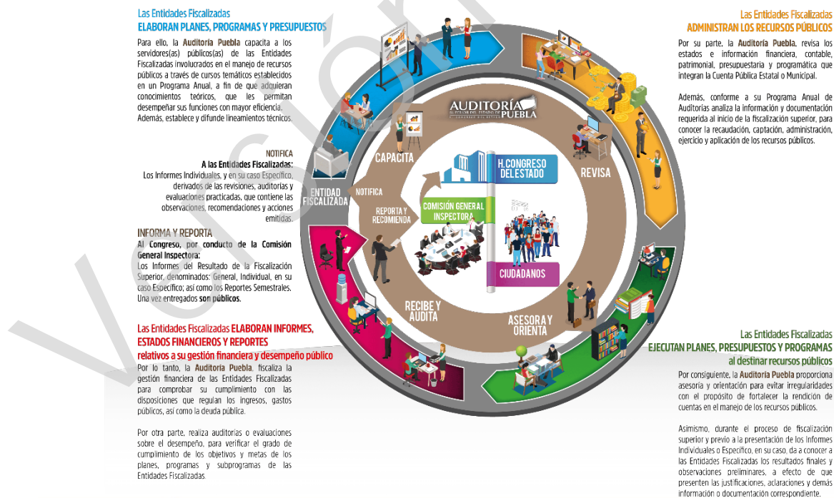
Diagrama 1 Proceso de Fiscalización Superior 2017