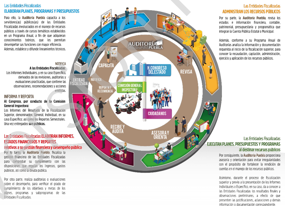
Diagrama 1 Proceso de Fiscalización Superior 2017