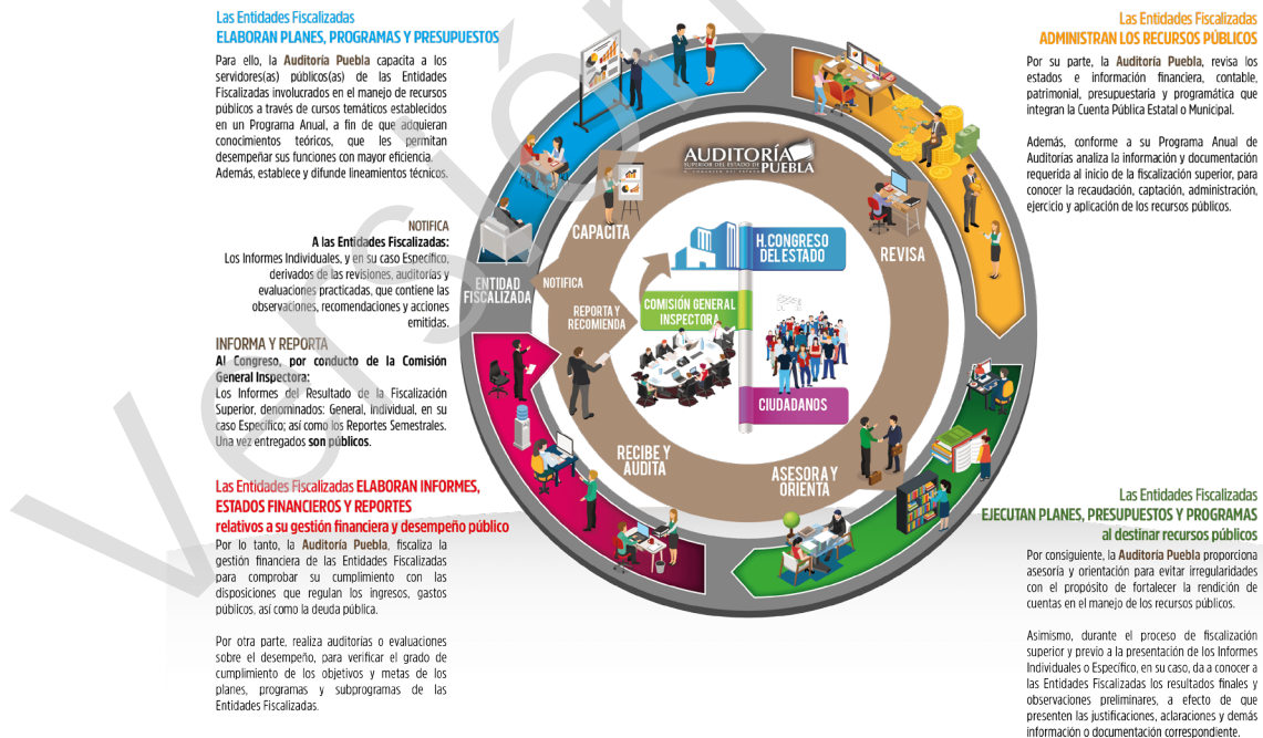
Diagrama 1 Proceso de Fiscalización Superior 2017