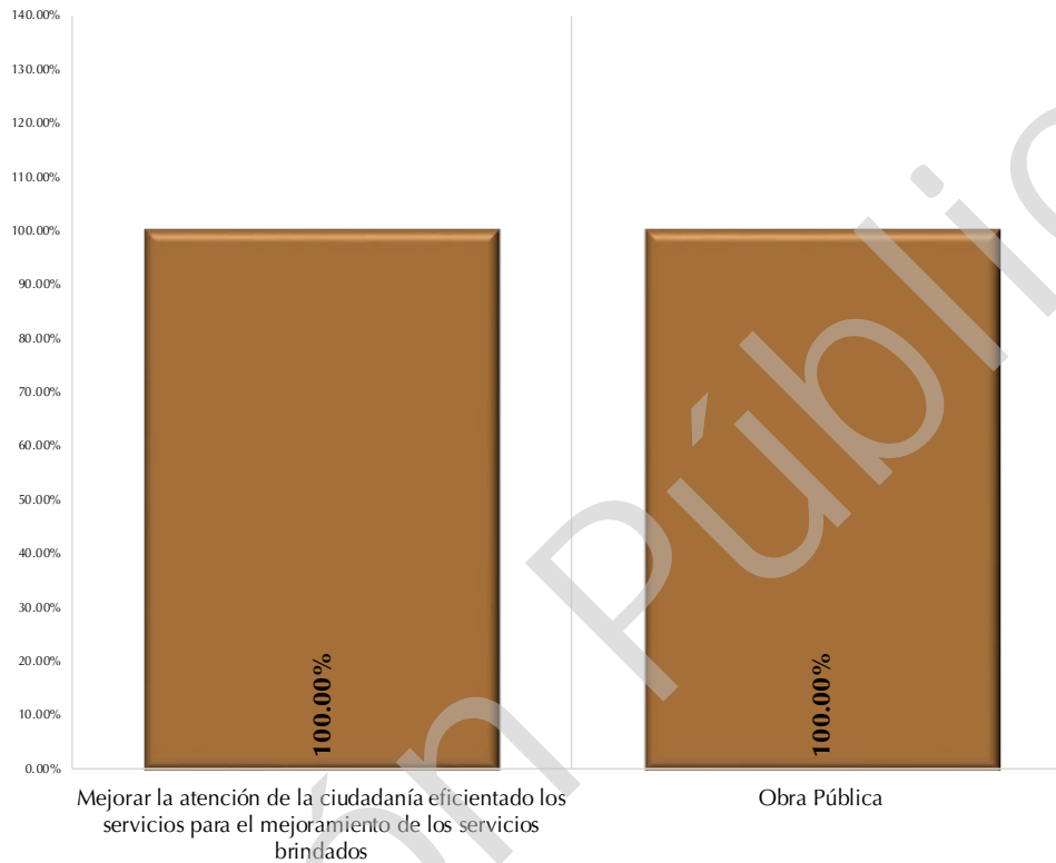
Gráfica 1 Cumplimiento de indicadores de Componentes por Programas Presupuestarios 2017 (Porcentajes)