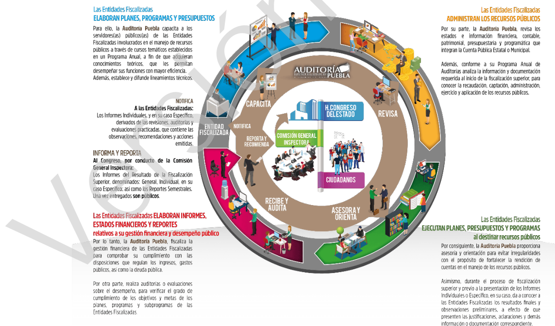
Diagrama 1 Proceso de Fiscalización Superior 2017