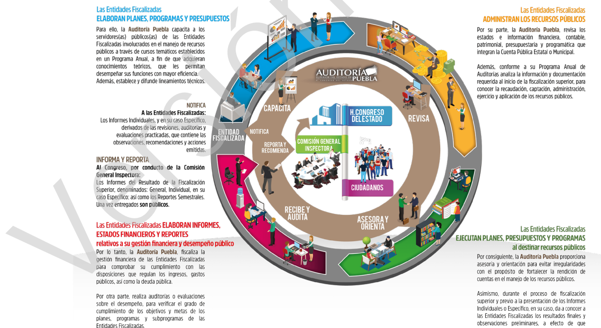
Diagrama 1 Proceso de Fiscalización Superior 2017