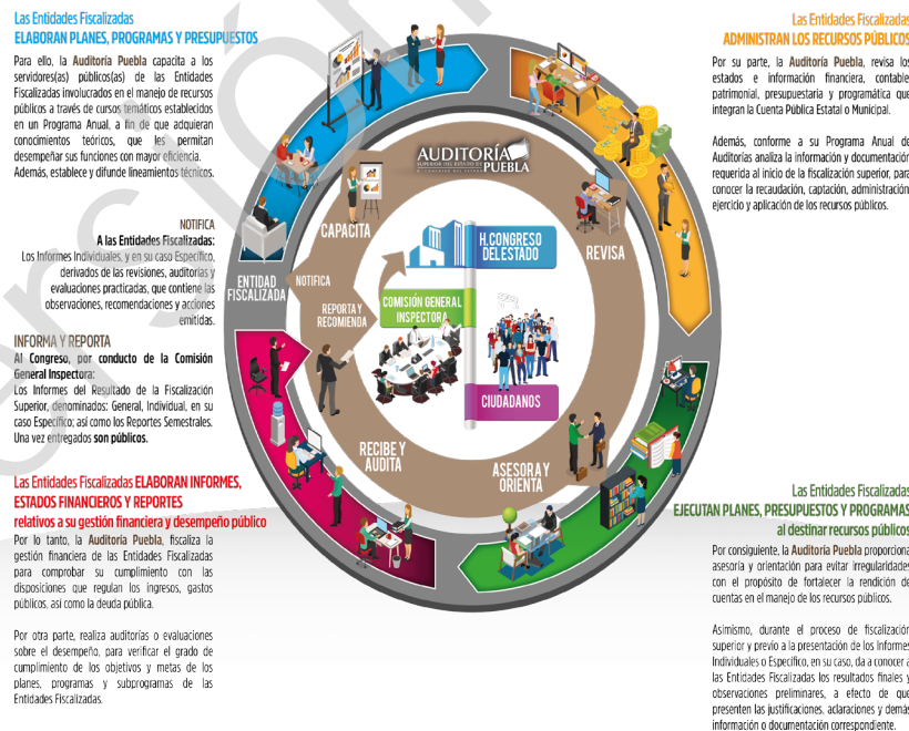
Diagrama 1 Proceso de Fiscalización Superior 2017