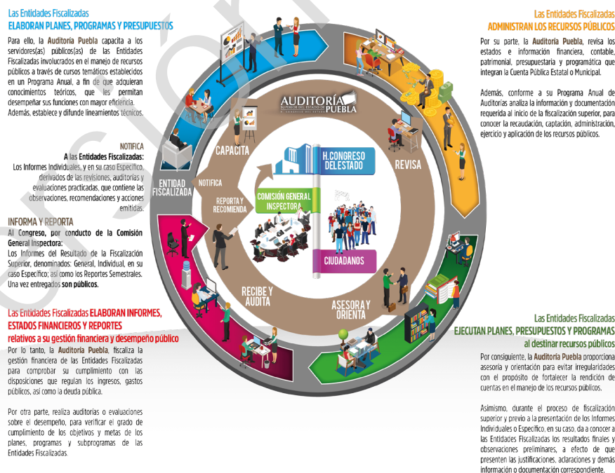
Diagrama 1 Proceso de Fiscalización Superior 2017