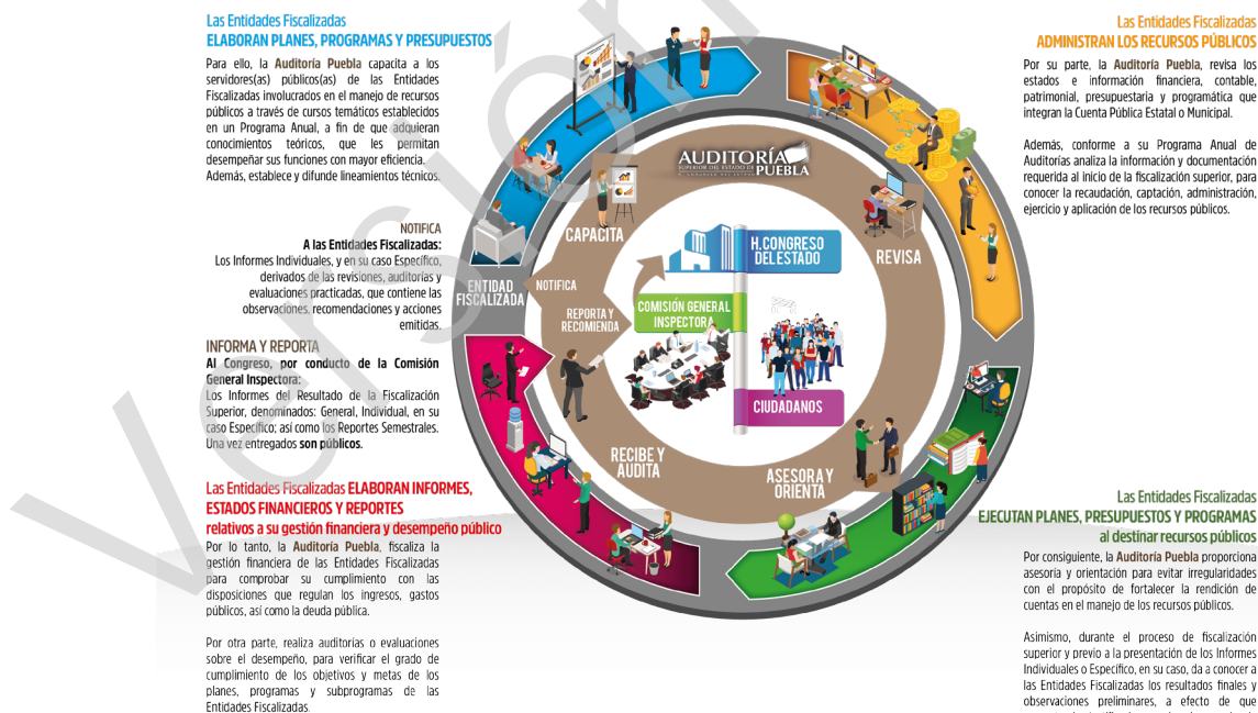
Diagrama 1 Proceso de Fiscalización Superior 2017