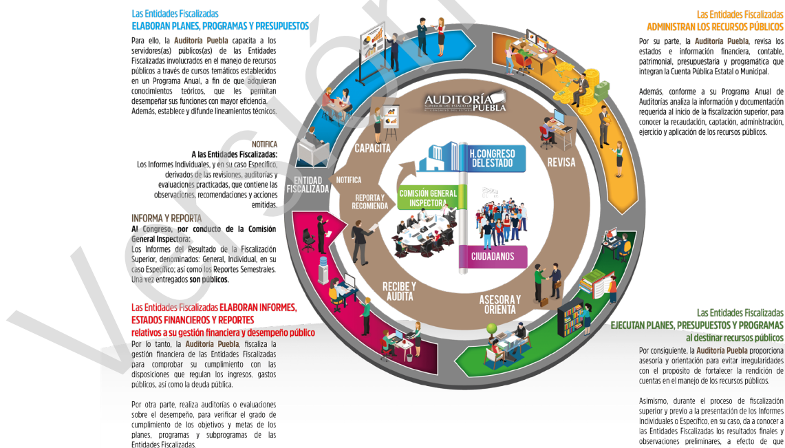
Diagrama 1 Proceso de Fiscalización Superior 2017