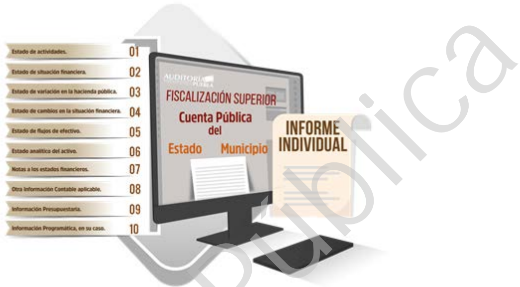
Diagrama 2 Enfoque a Procesos de la Fiscalización Superior 2016