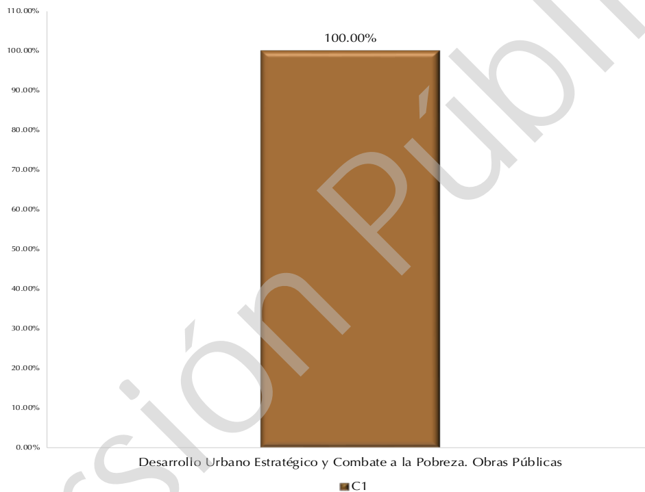
Gráfica 1 Cumplimiento de indicadores de Componentes por Programas Presupuestarios 2016 (Porcentajes)

El Programa Presupuestario “Desarrollo Urbano Estratégico y Combate a la Pobreza. Obras Públicas” contiene 1 indicador de Componente que mide los bienes y servicios que produce el Programa para generar los resultados y el impacto esperado con su ejecución; el indicador evaluado a nivel de Componente presenta un cumplimiento de 100%, apegado a su programación.