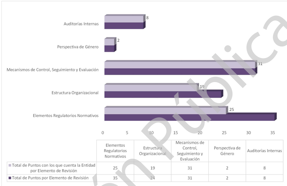
Gráfica 1 Cumplimiento de los Mecanismos de Control Interno Ejercicio 2020