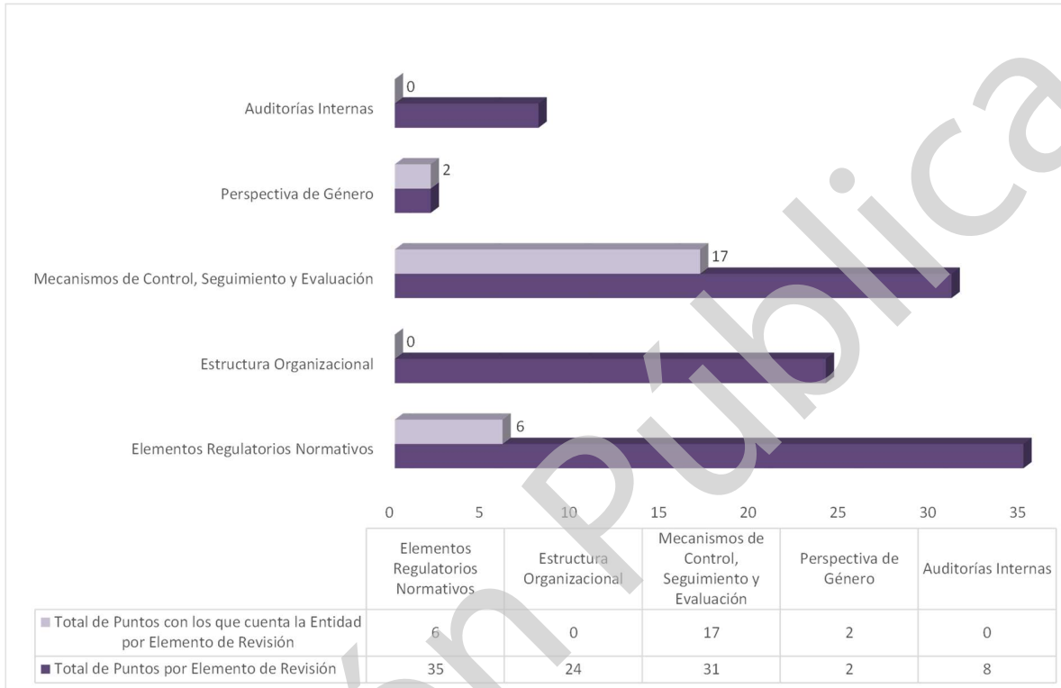
Gráfica 1 Cumplimiento de los Mecanismos de Control Interno Ejercicio 2020