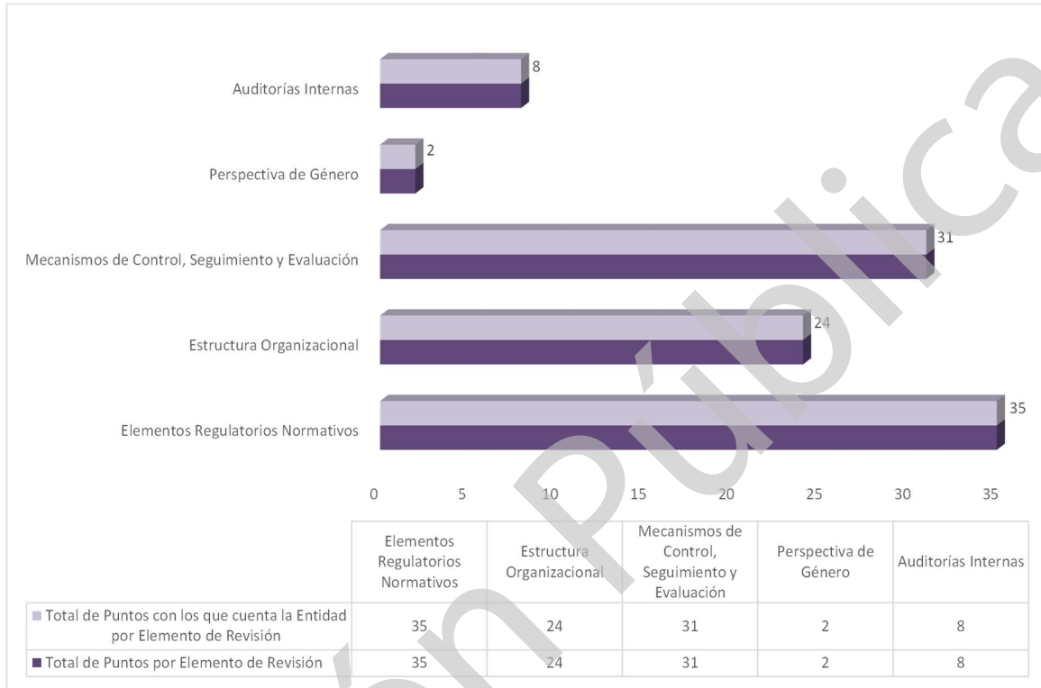
Grafica 1 Cumplimiento de los Mecanismos de Control Interno Ejercicio 2020