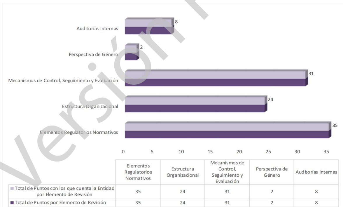
Gráfica 1 Cumplimiento de los Mecanismos de Control Interno Ejercicio 2020