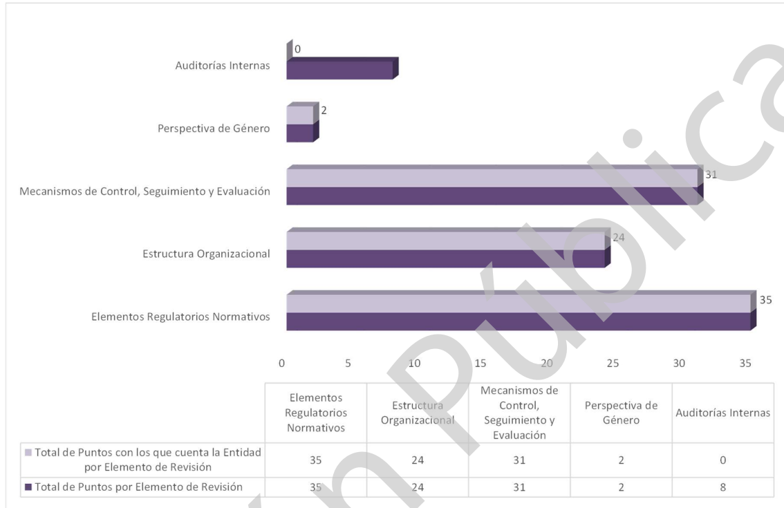
Grafica 1 Cumplimiento de los Mecanismos de Control Interno Ejercicio 2020