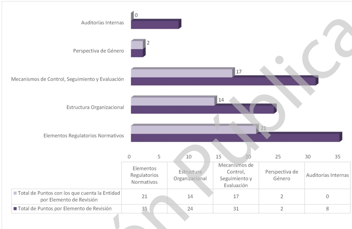
Grafica 1 Cumplimiento de los Mecanismos de Control Interno Ejercicio 2020