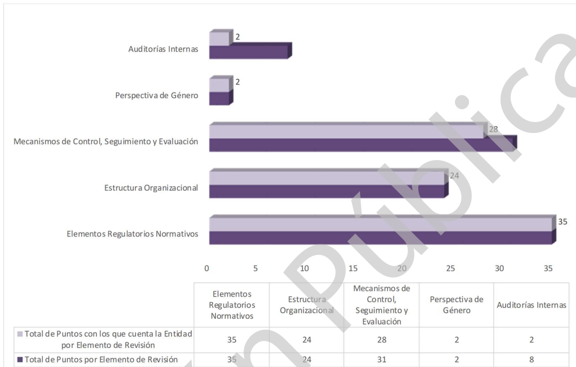
Grafica 1 Cumplimiento de los Mecanismos de Control Interno Ejercicio 2020